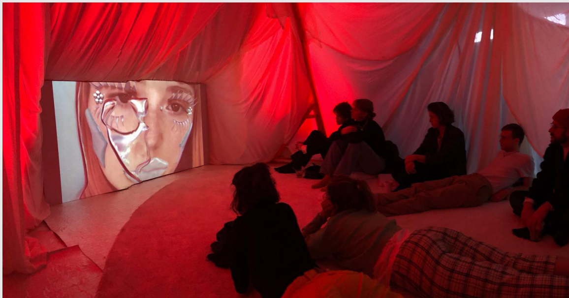
Presentatie 'Witches' bij Fabulous Future

Sinds 1998 heeft het netwerk meer dan 15.000 videowerken van makers van meer dan 120 nationaliteiten geproduceerd en gedistribueerd. De collectie wordt beheerd door Beeld en Geluid.