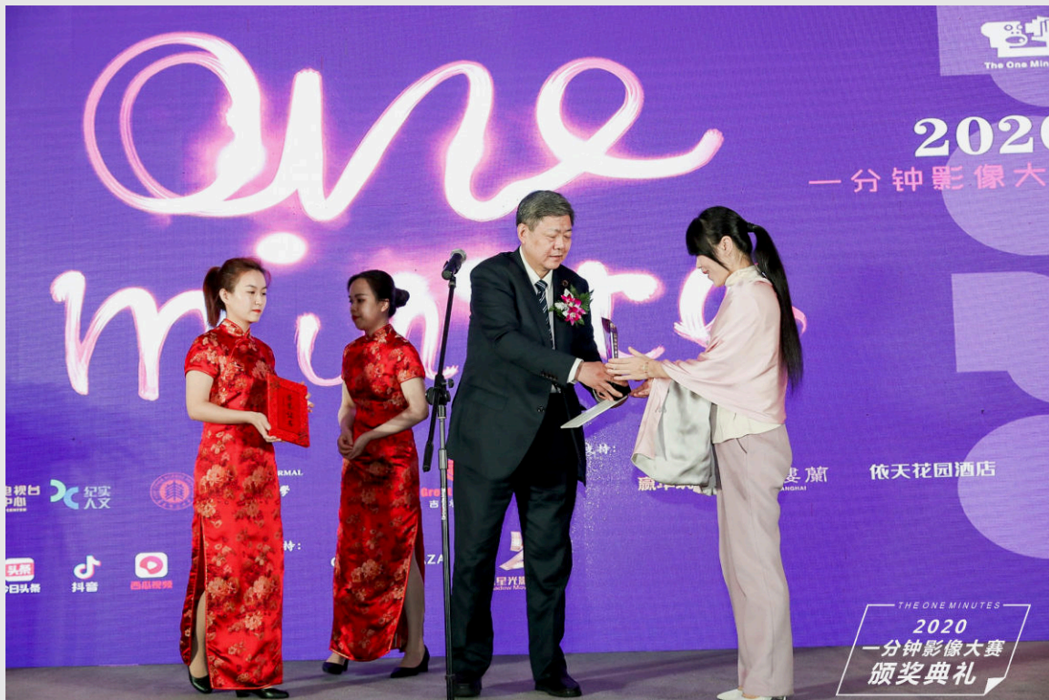
The One Minutes International Competition in Shanghai, november 2020

Wij hebben in 2020 zeven nieuwe gecureerde series ontwikkeld en vier workshops gegeven. In totaal zijn er 453 nieuwe werken geproduceerd. We hebben aan deze mensen een stem kunnen geven en hen een podium geboden. De werken werden geproduceerd in Amsterdam, in Nederland en over de hele wereld: in Afrika, Amerika, Australië, Azië en Europa. Er is een stijging van 14% van het aantal geproduceerde werken ten opzichte van 2019 te zien en de prognose voor 2021 is dat deze stijging doorzet. Onder makers is er een groeiende behoefte aan een plek voor experiment die openstaat voor nieuwe ontwikkelingen op het gebied van bewegend beeld. The One Minutes weet deze makers steeds beter te bereiken.