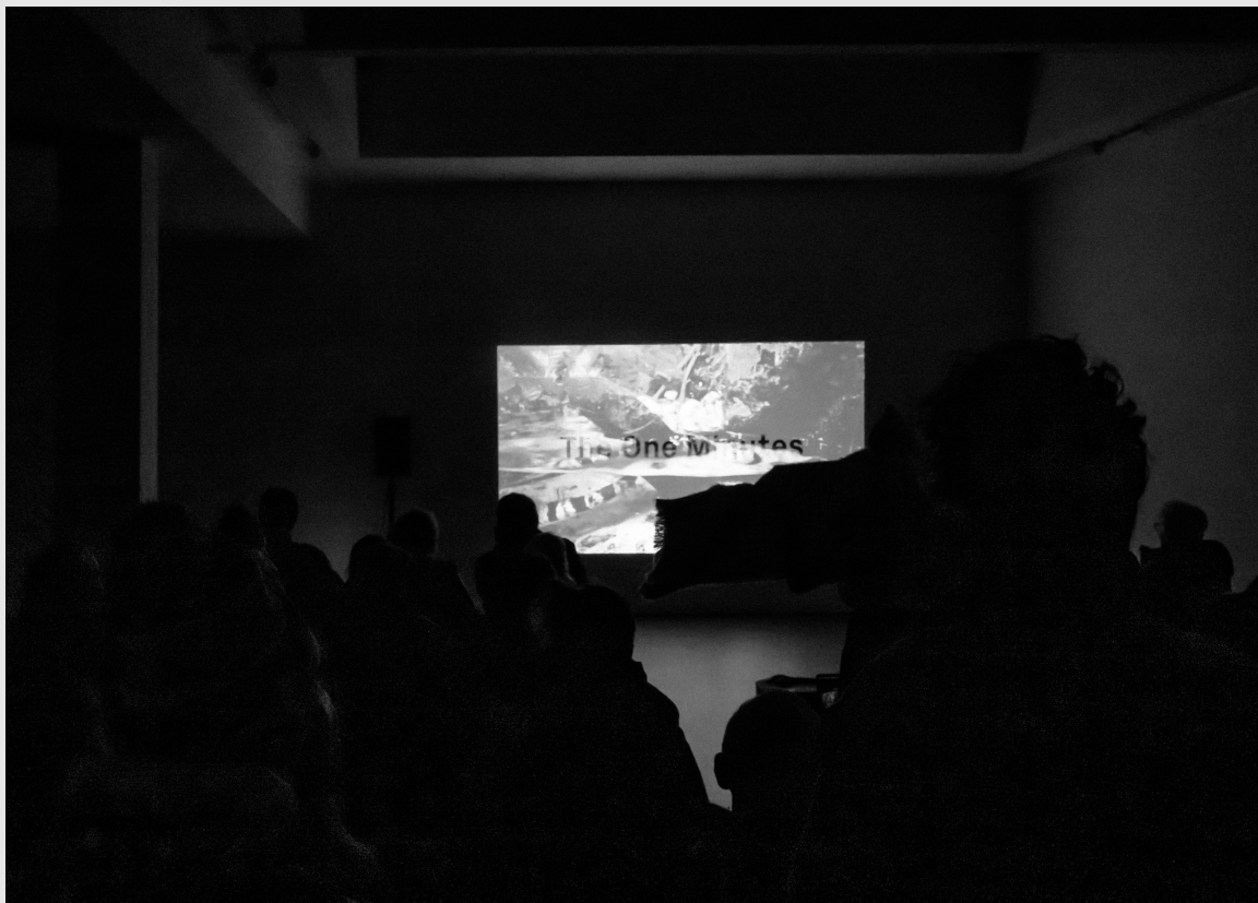
'Real Sur Real' bij ROZENSTRAAT – a rose is a rose

The One Minutes wil zichtbaar maken, verbinden en bijdragen aan de zelfexpressie via het medium éénminutenfilm. Al sinds haar ontstaan is Amsterdam een migratiestad. De stad is groot geworden dankzij de vele mensen die van over de hele wereld hier naartoe zijn gekomen en is inmiddels 'superdivers'; de meerderheid van de Amsterdammers bestaat uit een brede waaier van minderheden. TOM biedt een inclusief podium voor verschillende verhalen want als die verteld en gedeeld kunnen worden, ontstaan ontmoetingen en krijgen we meer begrip voor elkaar.