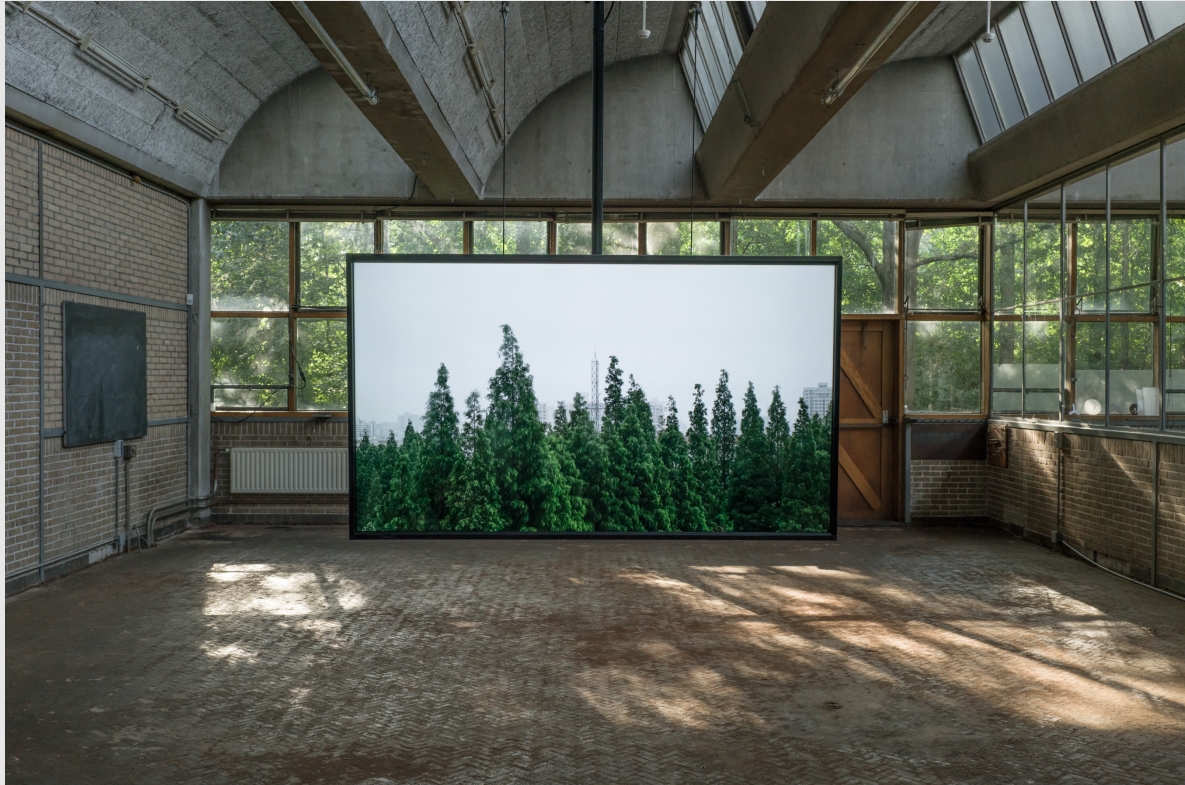
The One Minutes bij De School