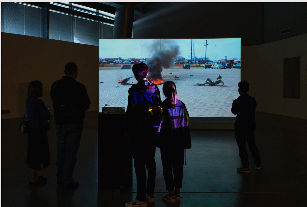
Prism of Freedom in Art Museum of Nanjing University of the Arts

The One Minutes heeft een breed en groot publiek en vertoonde haar werk zowel in internationale tentoonstellingsruimtes en musea (van Museum of the Moving Image in Astoria tot Studio Gallery BWA in Wroclaw, Polen) als festivals (van ICAF in Lagos en Techfestival. in Copenhagen tot Spring Performance Festival), filmfestivals (van Badrakhan in Cairo tot Internationale KurzFilmFestival Hamburg), conferenties, bioscopen (EYE, Tuschinski) wachtruimtes van ziekenhuizen, bibliotheken, universiteiten, academies, hotelkamers, openbare ruimtes (o.a. tijdens het Reykjavík International Film Festival op verschillende locaties in Kópavogu en Reykjavík) op televisie (het Chinese Dragon Television met een miljoenen publiek) tot online (o.a. via Cineville, Mister Motley en Instagram). Allen met hun eigen publiek en bereik. Ook tijdens de workshops die we over de hele wereld gaven van een kunstacademie in Nanjing tot een compound in Mogadishu werden onze films vertoond.