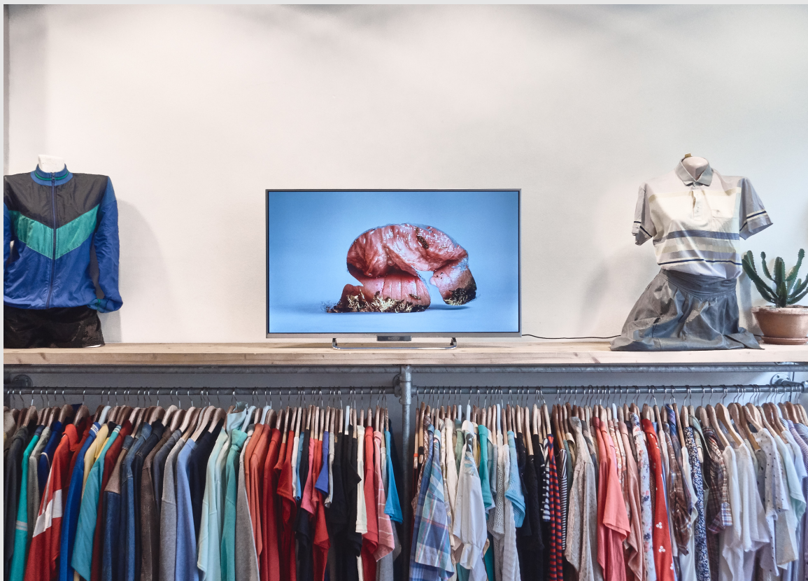
The Human Puppet bij Spring Performance Festival

»Een zwaar onderwerp in één minuut is onmogelijk, zou je denken, maar iedere video in de serie kent een eigen verbeelding van het vraagstuk.« Mister Motley