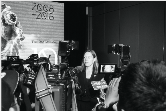
10 Years One Minutes in China in Shanghai Tower